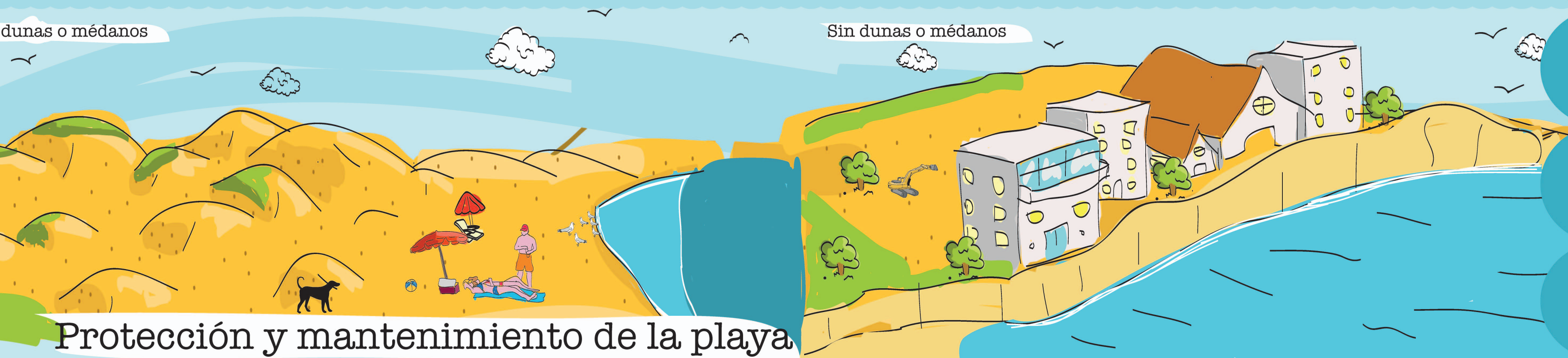
Protección y mantenimiento de la playa

Las dunas, este gran almacén de sedimentos móviles, alimentan la playa y protegen la costa.