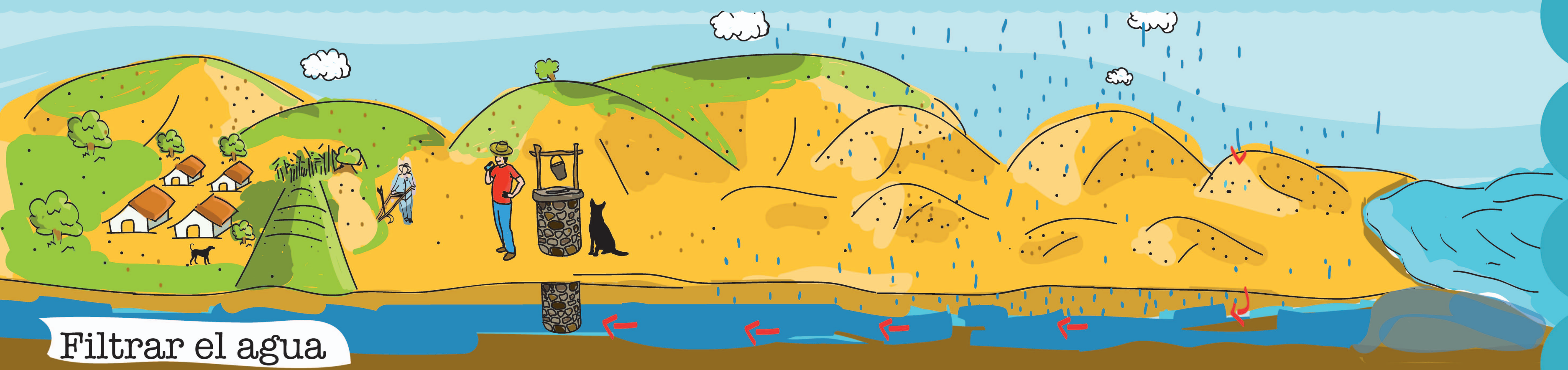
Filtrar el agua

Los médanos y las playas son paisajes de gran belleza y suelen ser lugares para divertirse.