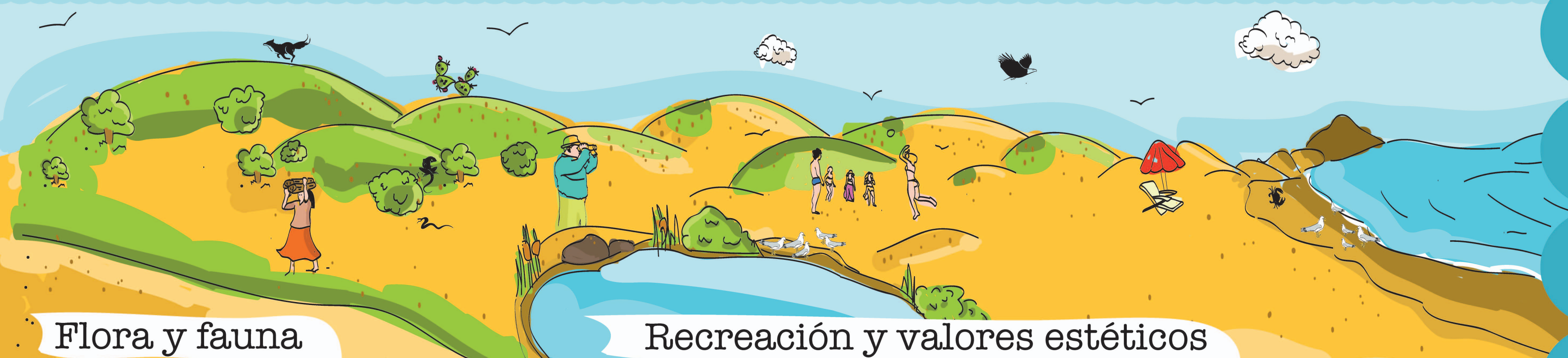
Flora y fauna

Las dunas o médanos son una barrera que detiene los fuertes vientos e inundaciones durante tormentas y huracanes, protegiendo los cultivos y poblados